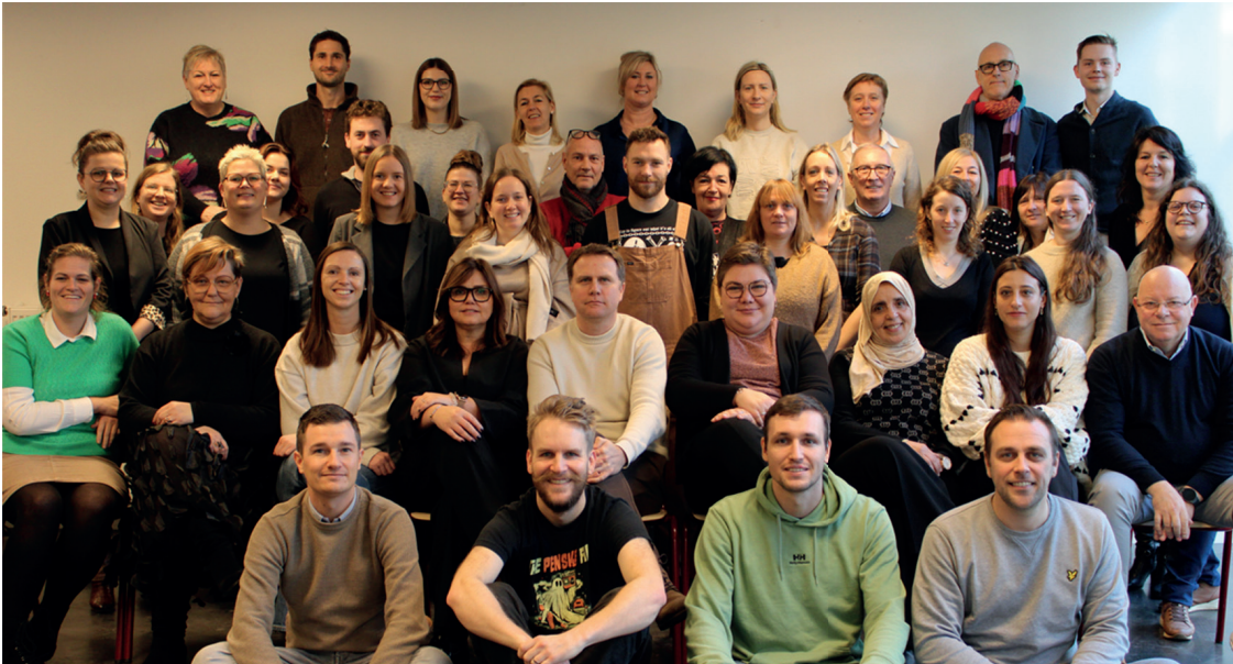
Ons toegewijd team van leerkrachten